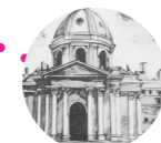
Académie des sciences 23 quai de Conti 75006 Paris

Succédant à Claude Lévi-Strauss au Collège de France, elle inaugure en 1982 la chaire « d'Étude comparée des sociétés africaines ». Grande aventurière, elle étudie l'universalité de la domination masculine et de l'inceste. Citoyenne engagée, elle préside le Conseil national du sida de 1989 à 1995. Le cœur à gauche, elle lutte contre la colonisation, le racisme et se bat pour l'égalité femme-homme. Elle obtient de nombreux prix et distinctions. Toujours animée d'une joie de vivre, elle meurt à Paris le jour de ses 84 ans.