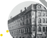
ESPCI École Supérieure de Physique et de Chimie Industrielles 10 rue Vauquelin 75005 Paris