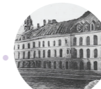
Maison de Sophie Germain 13 Rue de Savoie 75006 Paris