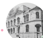
Faculté de Médecine 15 rue des Écoles 75005 Paris