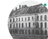
L'École Polytechnique (ou X) 1 rue Descartes 75005 Paris

Marie Curie arrive en France en 1891. Elle obtient à la Sorbonne une licence de sciences physiques (1893) et de mathématiques (1894). Elle travaille sur la radioactivité naturelle avec Pierre Curie qu'elle épouse en 1895. Première femme lauréate du prix Nobel de physique, avec son mari (1903), elle obtient seule le prix Nobel de Chimie (1911). L'Institut Curie est né de sa volonté. Elle fut membre de la Commission internationale de coopération intellectuelle mise en place par la Société des Nations, pour la science et pour la paix. Sa notoriété est telle qu'elle est la première femme scientifique à entrer au Panthéon en 1995.