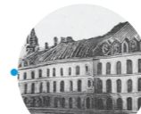
L'École Normale Supérieure 45 rue d'Ulm 75005 Paris