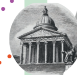
PANTHÉON Place du Panthéon 75005 Paris