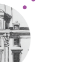
Collège de France 11 Place Marcelin Berthelot 75005 Paris