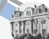
Musée Curie 1 rue Pierre et Marie Curie 75005 Paris